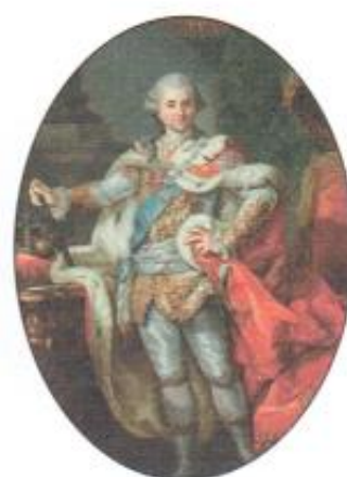
Stanisław August Poniatowski