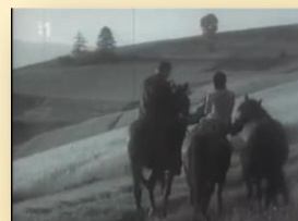
M. Figuli: Tri gaštanové kone

Tolko žiadam od Hospodina, ktorý bol Bohom Jakubovým, a chcem, aby bol Bohom aj mojím, lebo až do nebies siahá milosrdenstvo jeho, nad oblaky vyvýšená je pravda jeho a nad mohutnosťou vystupuje spravodlivosť jeho.